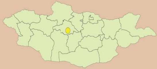
Заяын хүрээний газарзүйн байршил