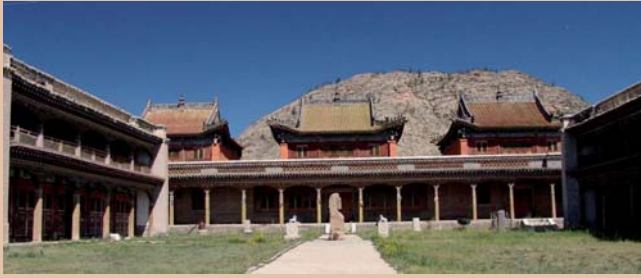
Заяын хүрээ (2007 оны 6-р сар)