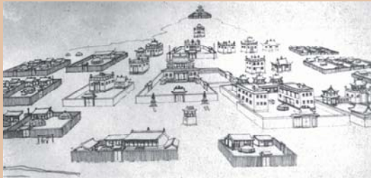
Хийдэд хадгалагдаж буй Цэцэрлэг хотын гар зураг

2007 оноос Монгол-Монакогийн хамтарсан археологийн экспедицийн судлаачид хийдийн эвдэрч гэмтсэн хэсгүүдийг сэргээн засварлах ажлын урьдчилсан судалгааг хийж эхлээд байна.