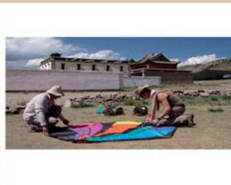
Хийдийн агаарын зургийг цаасан шувууны тусламжтайгаар авахаар бэлтгэж буй нь