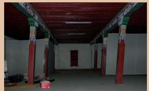
Зүүн дуганы дотоод байдал