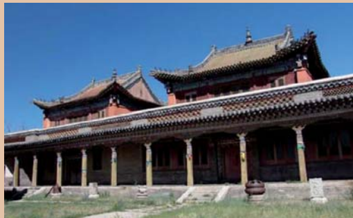
Лавирангийн нүүрэн тал